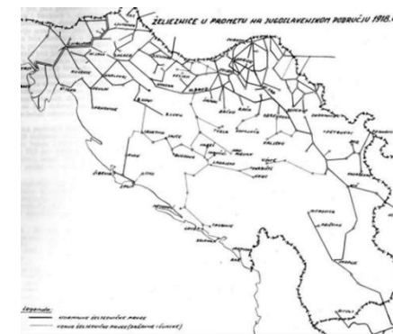
Slika 6. željeznice u prometu na jugoslavenskom području 1918. godine