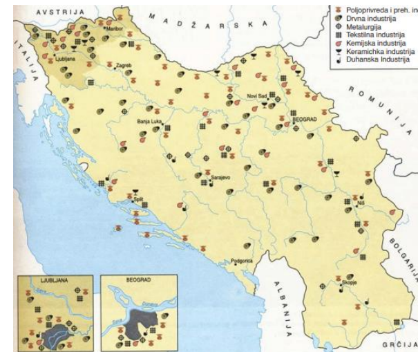
Slika 2. industrija u prvoj Jugoslaviji

Hielscher, Kurt: Kraljevina SHS. Knjižara Vera v Ljubljani, 1926