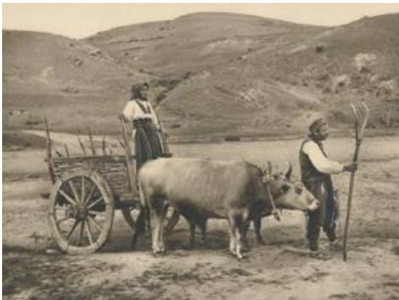
Slika 1. seljaštvo i njihovo oruđe za obradu zemlje

Hielscher, Kurt: Kraljevina SHS. Knjižara Vera v Ljubljani, 1926