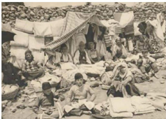
Slika 5. tržnica u Prizrenu, Kosovo